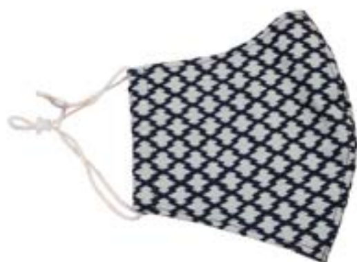
藍染マスク 2,200円(税込)

表地 綿100% 裏地 二重ガーゼ綿100% 製造 おんだ寝具店 企画・販売 (一社)三郷市観光協会