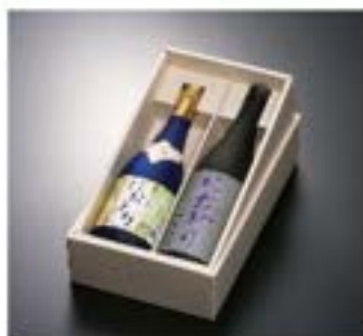
限定特別純米酒+純米原酒 箱入り 4,400円（税込）