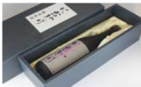
純米原酒 720ml 1本箱入り 2,800円（税込）