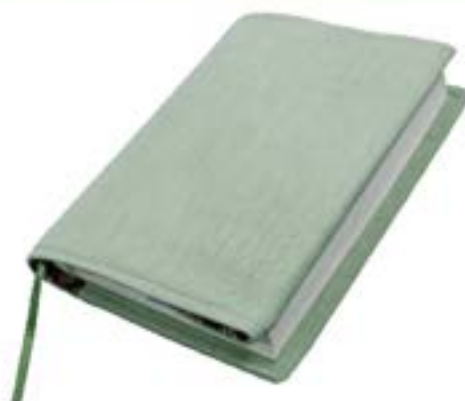
小松菜染めブックカバー 1,500円(税込)

表地 ウール100% 裏地 二重ガーゼ綿100% 製造 おんだ寝具店 企画・販売 (一社)三郷市観光協会