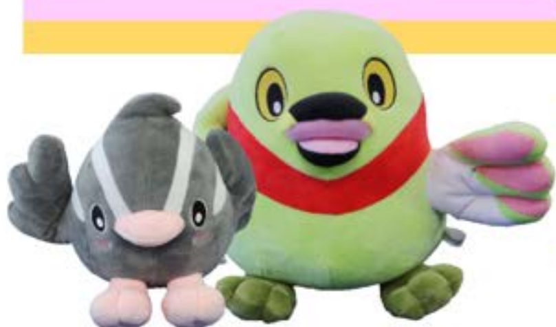
ぬいぐるみ かいちゃん (右)