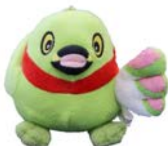
ぬいぐるみミニ かいちゃん