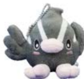
ぬいぐるみミニ つぶちゃん