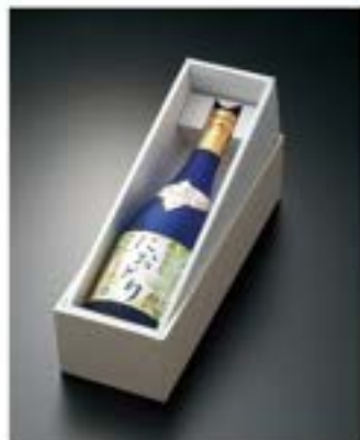
限定特別純米酒 720ml 1本箱入り 1,950円（税込）