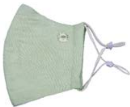
小松菜染めマスク 1,300円(税込)

三郷市は全国でも有数の小松菜の産地。 小松菜で染めた優しい色合いの緑が特徴的な商品です