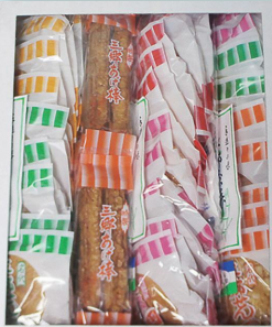
三郷市特産品見本 (商品の内容が変更になる場合があります。)